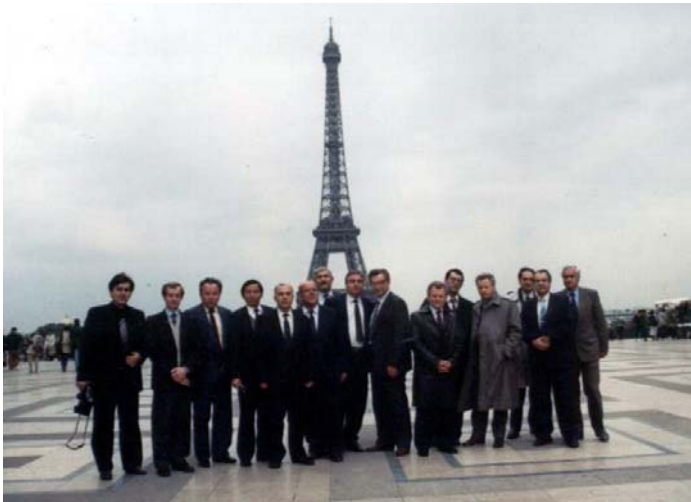
1991. Miniștrii Justiției fostelor Republici Unionale în vizită la Paris