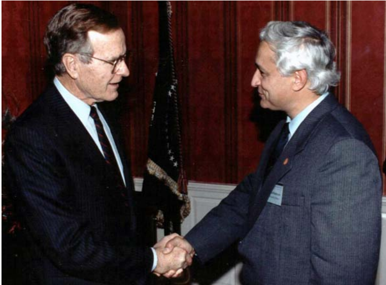
1990. Ministrul Justiției RSSM în vizită la George Bush, Președintele SUA