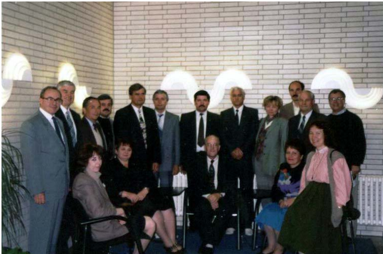
1995. La cursuri de perfecționare în Germania