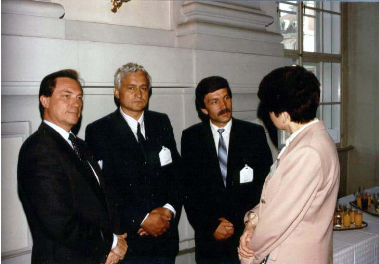
1993. Întrevedere cu Ministrul Justiției al Germaniei