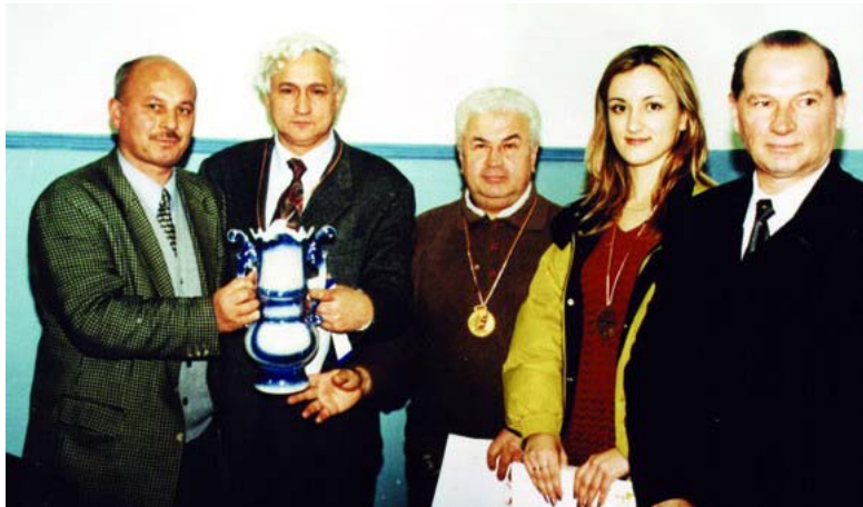
2001. Echipa ULIM. Campioană Republicii la sah pe echipe