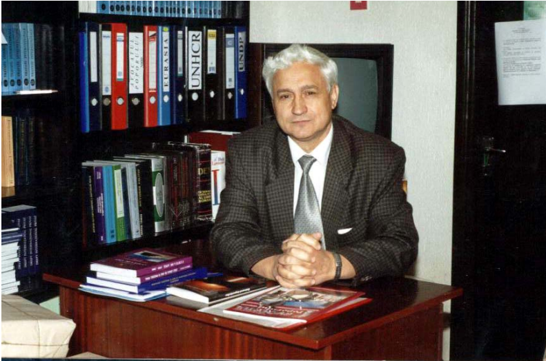
1999. Director al Centrului de Drept al Avocaților