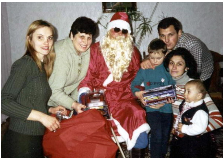
2001. În calitate de Moș Crăciun, în sînul familiei