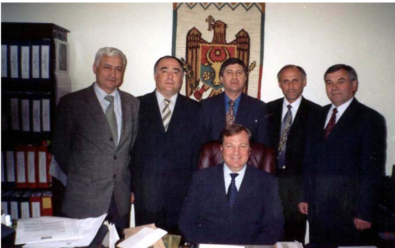
2004. Un grup de juriști la Ambasada RM în SUA