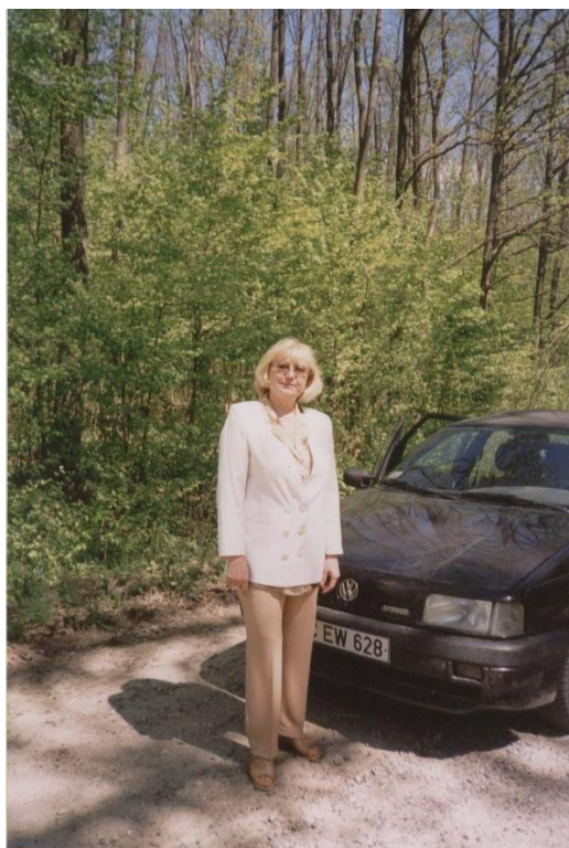
На отдыхе 2002 год. Село Старые Резены.