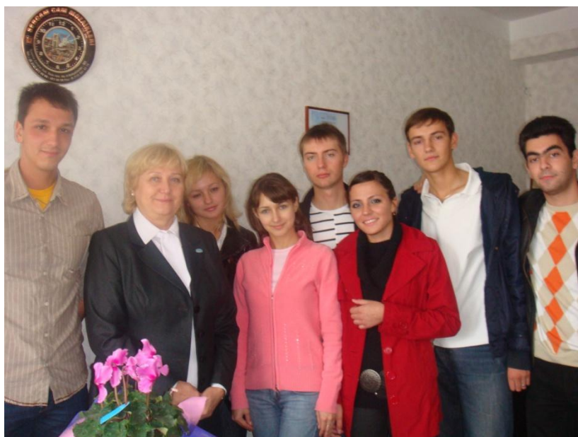
2009 год. Куратор группы экономического факультета, УЛИМ.