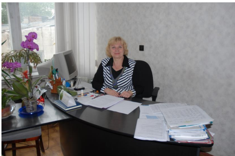
Один из рабочих дней 2010 года.