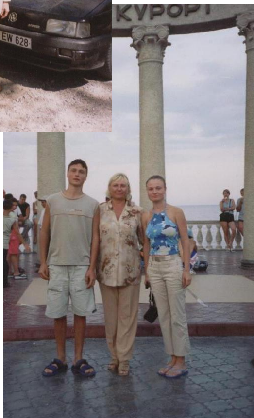
С сыном и дочерью на отдыхе в Крыму. 2002 год.