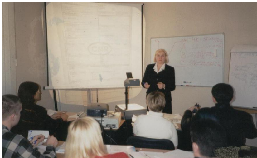
2002 год. Лекции экспортерам при Международной организации по продвижению экспорта.