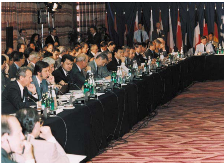
11 iunie 1993. Atena. Consiliul de Cooperare Nord-Atlantic la nivel de Miniștri de Externe