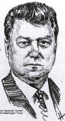
Illustration by Alexander Hunter/ The Washington Times