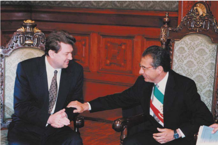
19 aprilie 1996. Mexico. Ceremonia înmânării scrisorilor de acreditare Președintelui Mexicului Ernesto Zedillo Ponce de Leon