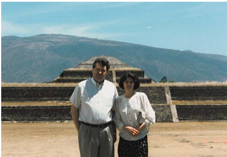
După ceremonie, la Piramidele din Mexic