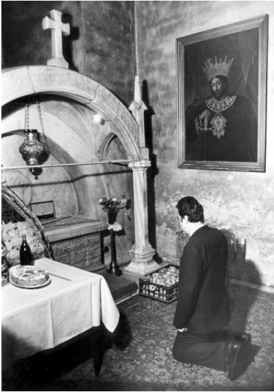
14 februarie 1991. Mănăstirea Putna. La mormântul lui Ștefan cel mare și Sfânt