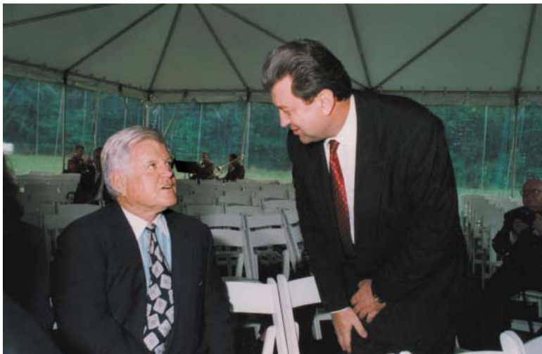
Încă un simpatizant al Republicii Moldova: Edward Kennedy, senator de Massachusetts