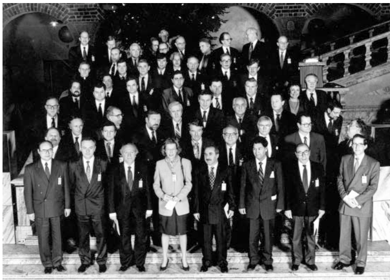
15 decembrie 1992. Stockolm. Summitul CSCE la nivel de Miniștri de Externe