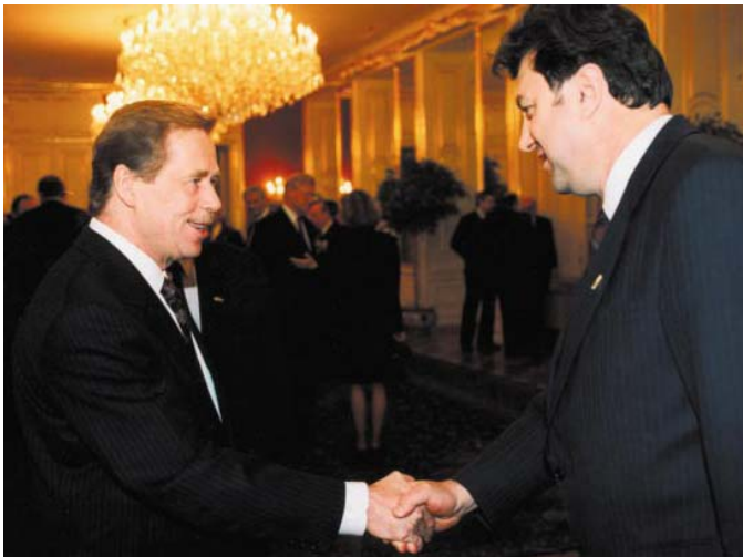
30 ianuarie 1992. Cu Vaclav Havel, Președintele Cehoslovaciei