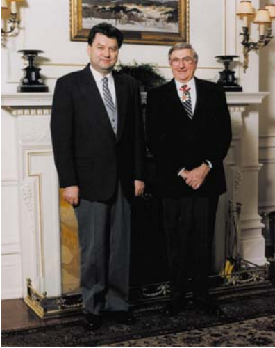
23 noiembrie 1995. Ottawa. După înmânarea scrisorilor de acreditare, cu Excelența Sa Romeo Le Blanc, Guvernatorul General al Canadei