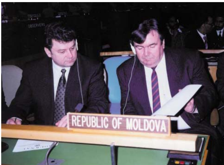
2 martie 1992. Cu Mircea Snegur, Președintele Moldovei, la prima ședință a Sesiunii Adunării Generale a ONU