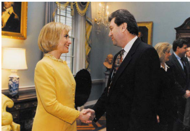
17 iulie 1998. Întrevedere cu Hilary Clinton după expedierea unui lot de ajutor umanitar către Moldova