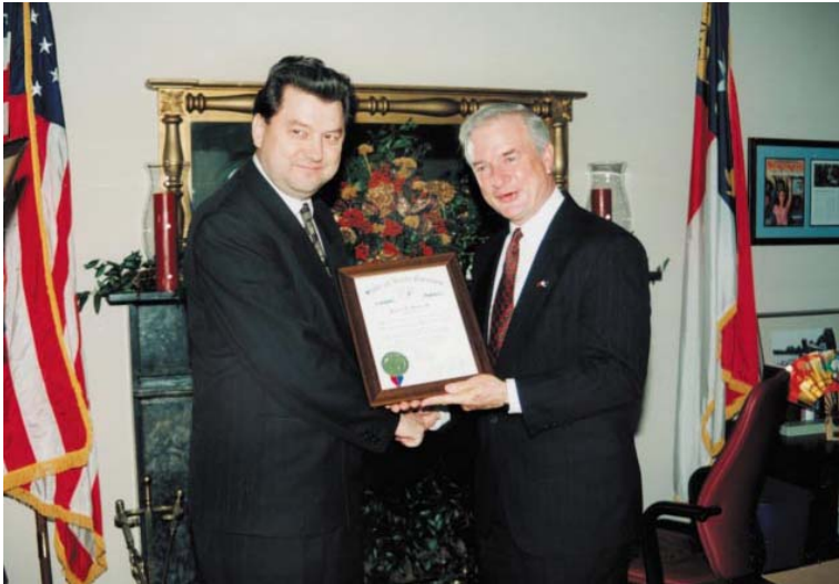
6 decembrie 1995. James B. Hunt Jr., Guvernatorul statului Carolina de Nord confirmă statutul de cetățean de onoare al acestui stat