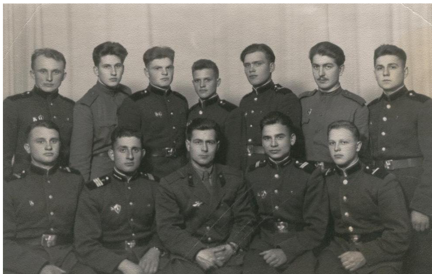
1960. Împreună cu prietenii în timpul serviciului militar