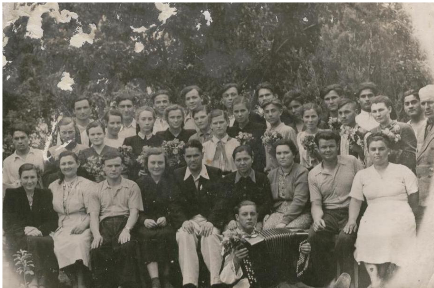
1957. Împreună cu colegii de clasă și profesorii Școlii Medii din satul natal