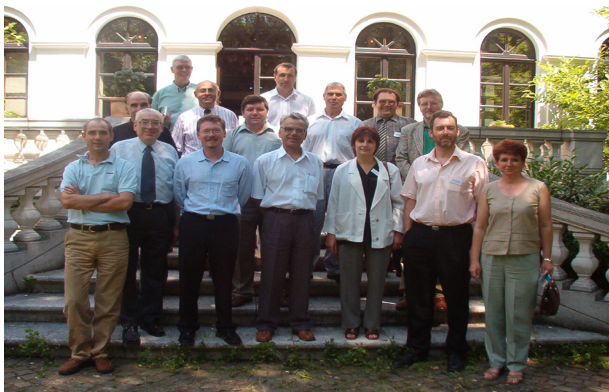
2003. La Institutul Georg Eckert, Brounsweig (Germania)