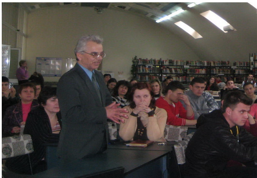
2009. La o lansare de carte