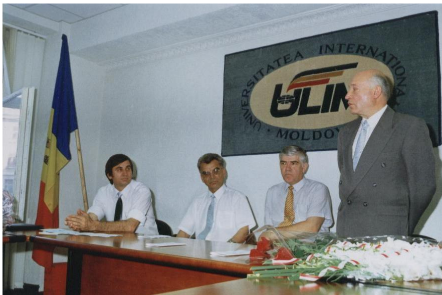
1999. La aniversarea de 60 de ani