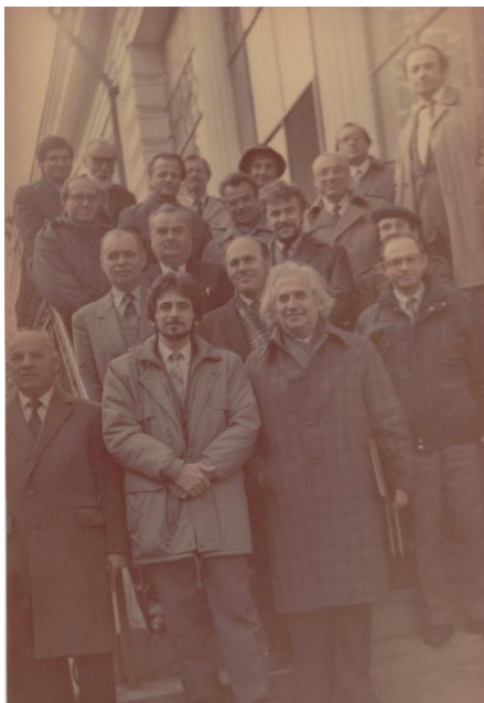
1995. Cu colegii de la Chișinău și de la Iași, în fața Universității „Al. I. Cuza”