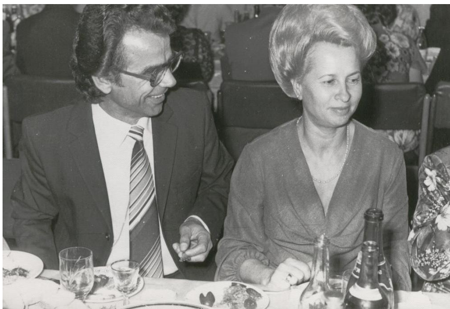
1999. Împreună cu soția la o „sindrofie”