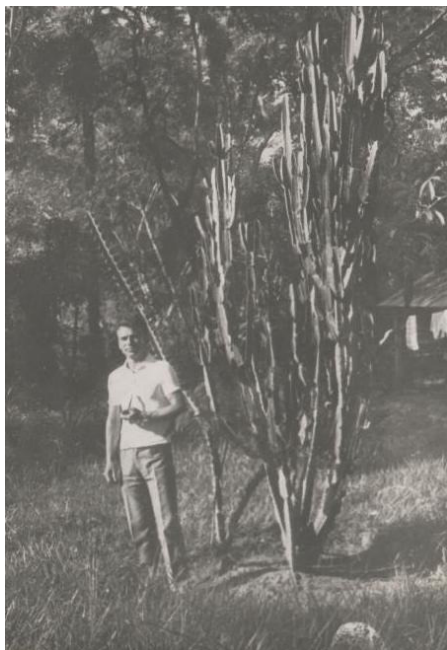
1968. Pe fundalul unui peisaj congolez