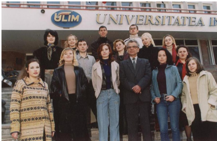
2004. Împreună cu studenții absolvenți