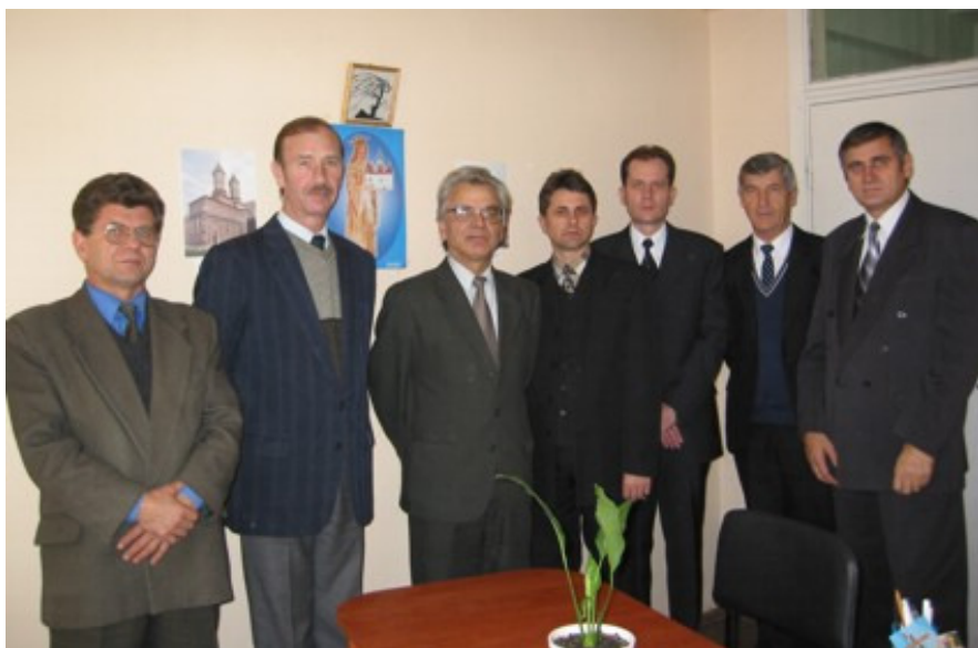
2002. Împreună cu colegii Catedrei Istoria Românilor