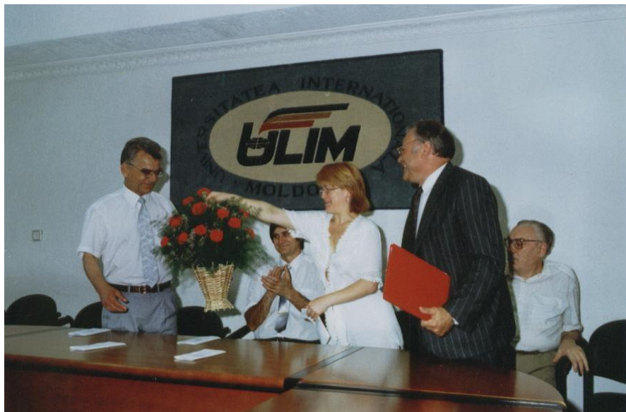
1999. La aniversarea a 60 de ani