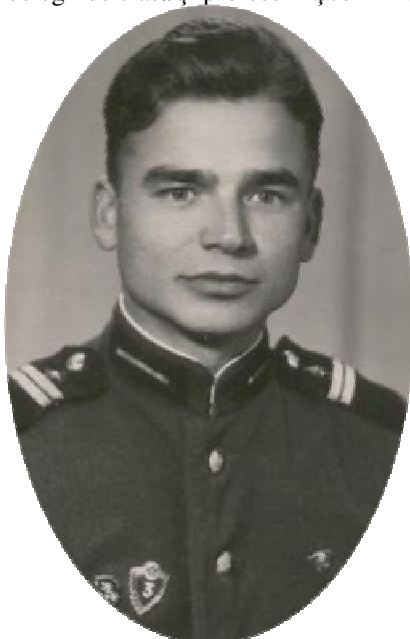
1960. În serviciu militar