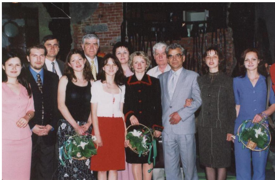
2002. Cu ocazia înmânării „Burselor de merit” studenților de la Facultate