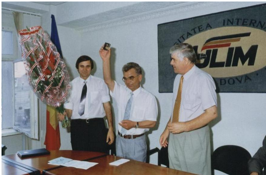
1999. Laureat al celei mai mari distincții – Ordinul ULIM, Nr. 1