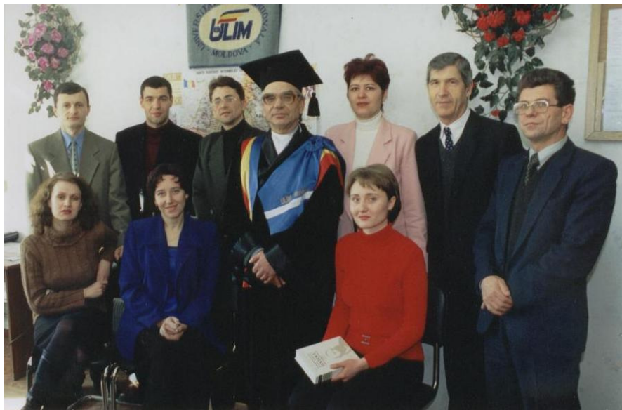
2003. Împreună cu colectivul profesoral-didactic al Facultății