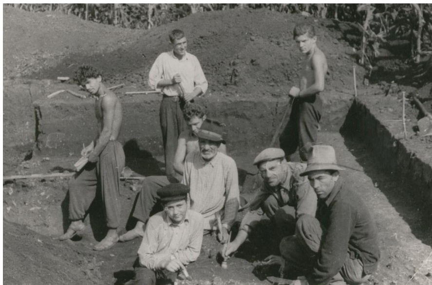
1962. Pe șantierul arheologic din satul Sobari, raionul Soroca