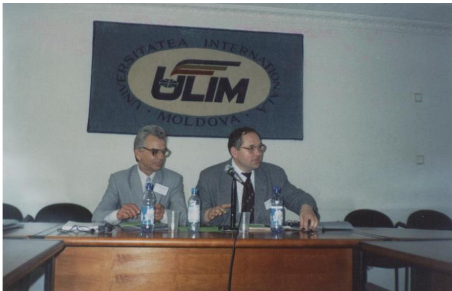
2003. Moderator la simpozionul româno-polon (ULIM)