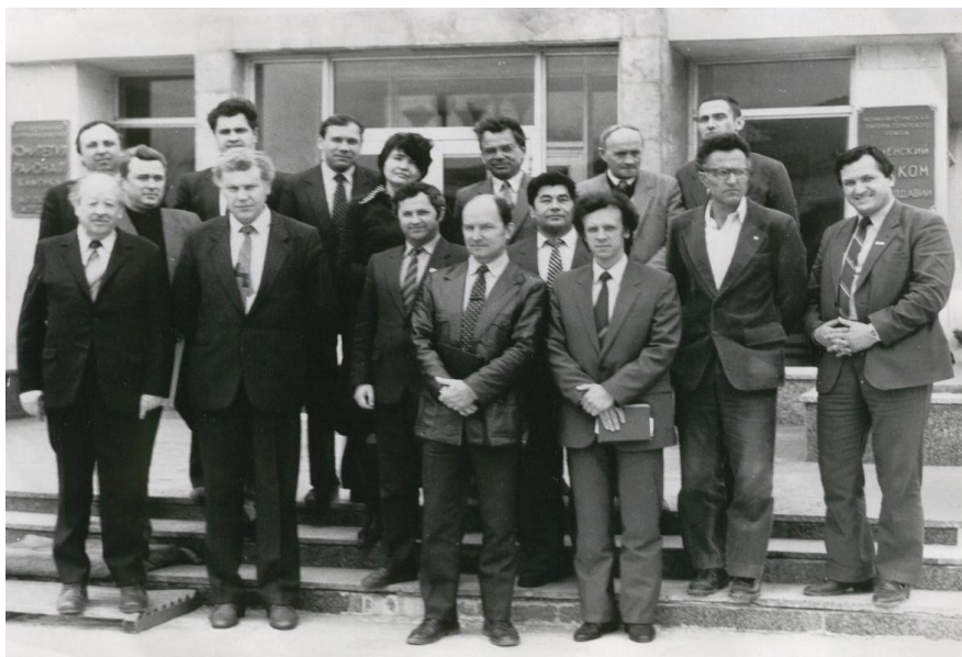
1989. Membru al grupului de agitație privind „perestroika”, Camenca