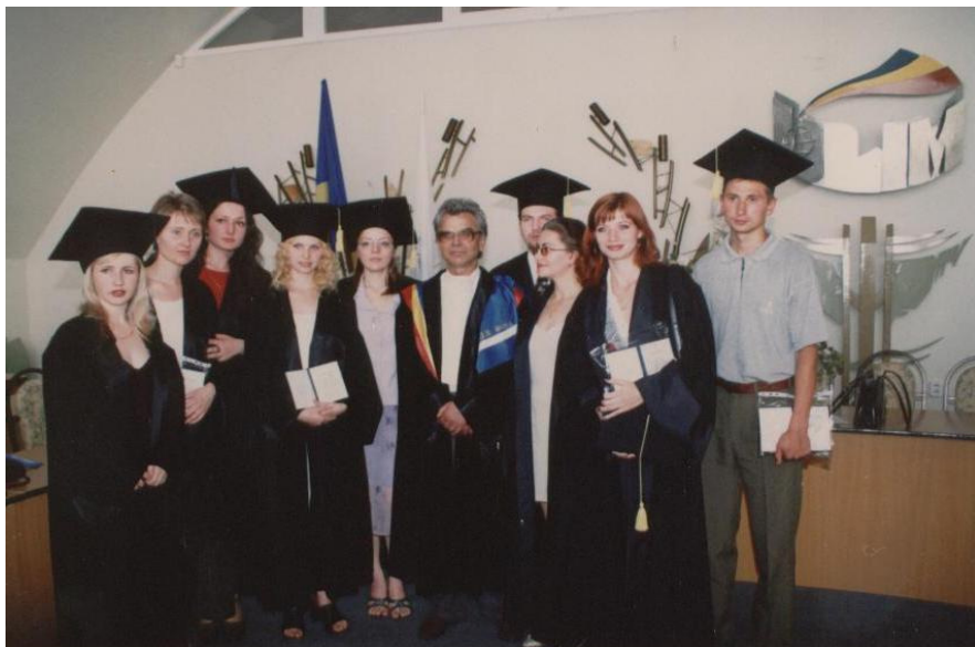
2002. Împreună cu absolvenții Facultății