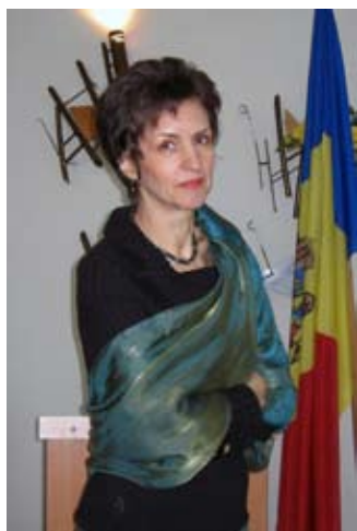
Ipostaze universitare Chişinău, ULIM