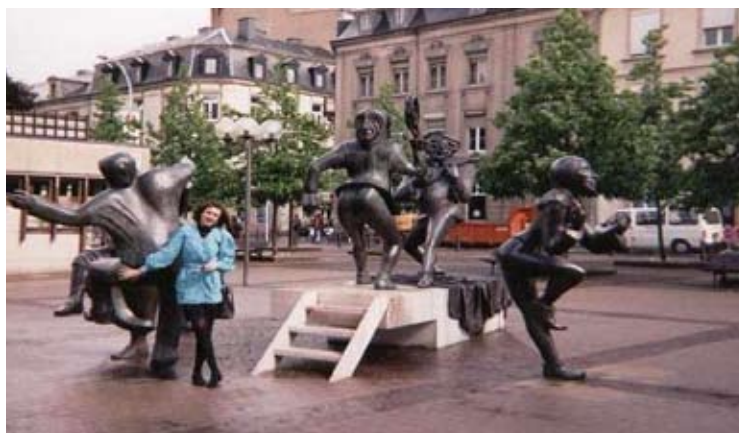
Un vals la Luxembourg