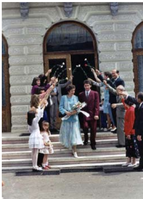
Viitorul este al nostru...