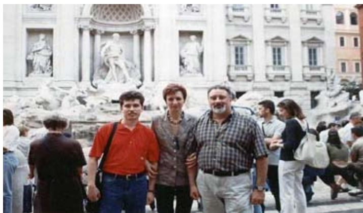
Dați-Vă un rendez-vous la havuzul Trevi, Roma