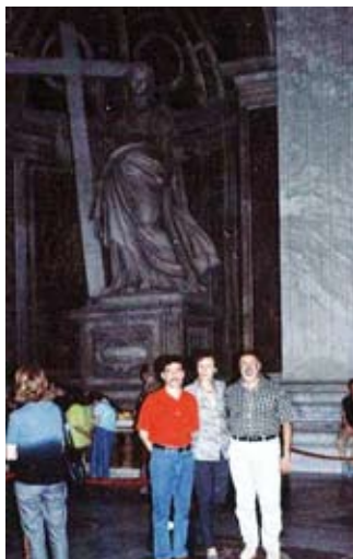
Grandeur et splendeur du Vatican