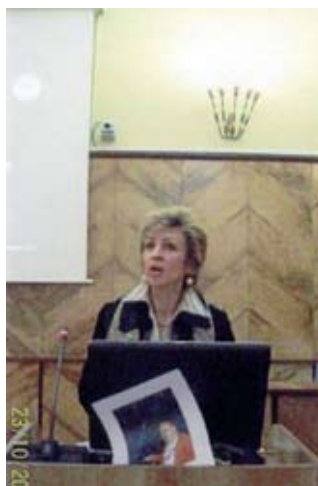
Ipostaze colocviale, Iaşi