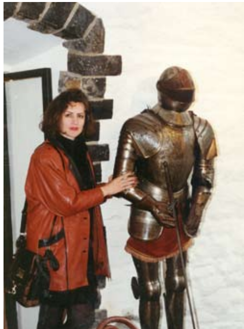
La braț cu Istoria