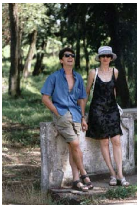
Bonjour, ma joie de vivre !