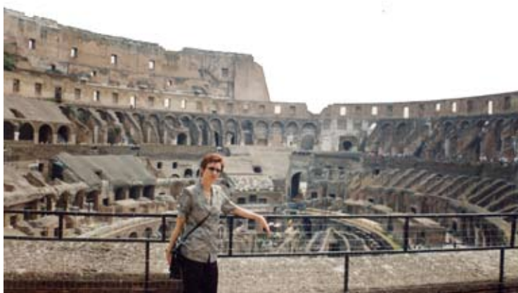
Ave Caesar, morituri te salutant! Colliseum, Roma