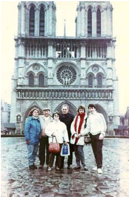
Victor Hugo disait: Ils viendront de partout voir Notre-Dame de Paris