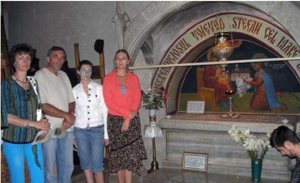
Putna, istoria noastră de ieri și de totdeauna