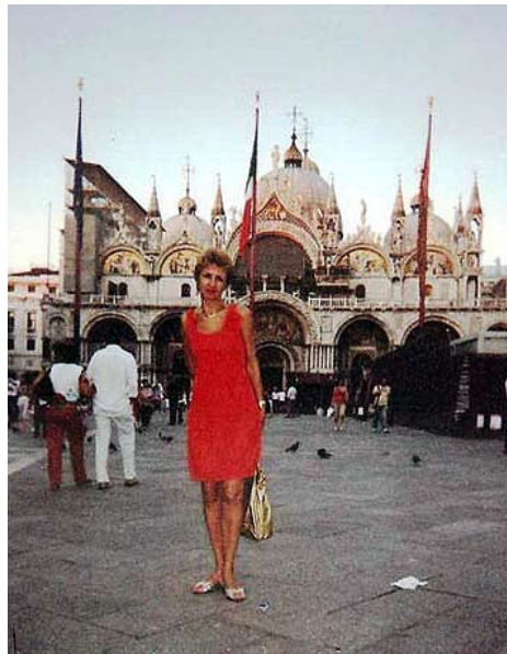
Ah, viața falnicei Venetii ...