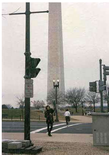
Noi deschideri și explorări. Coloanele infinitului la Paris și la Washington