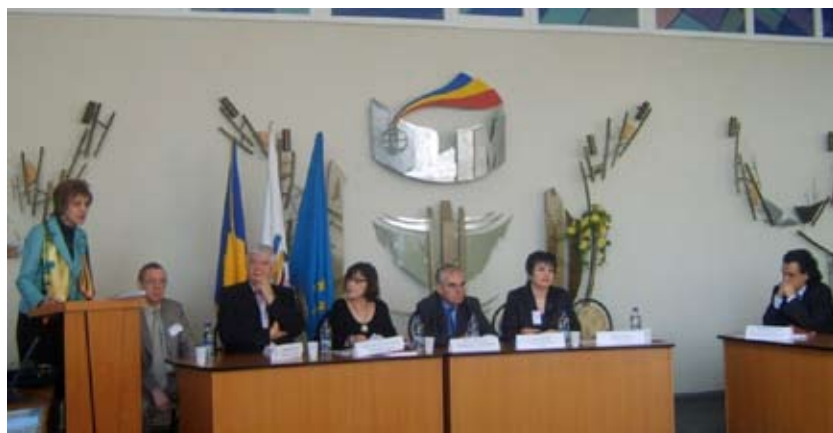
Edițiile și treptele colocviului internațional Francopolyphonie la ULIM