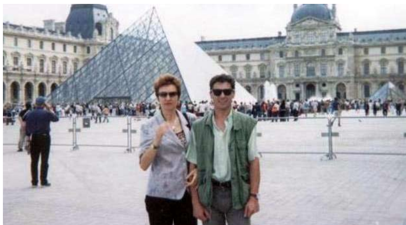
Vino să vezi Luvrul de ieri și de azi!