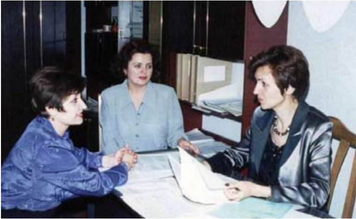
Din experiența de decan al Facultății Limbi și Literaturi Străine