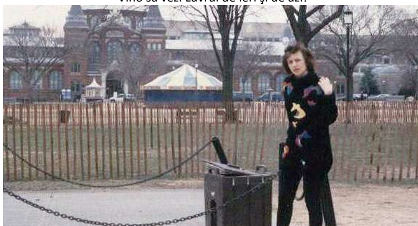
În marile muzeie ale lumii, New York