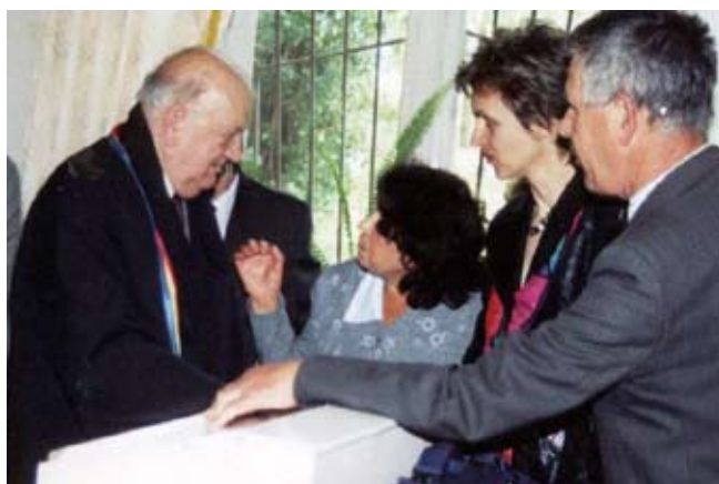
Universul filologic din scoică. Cu renumitul filolog român Eugen Coşeriu