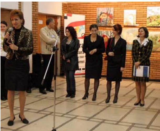
Cu Tonița Art Grup , Suceava