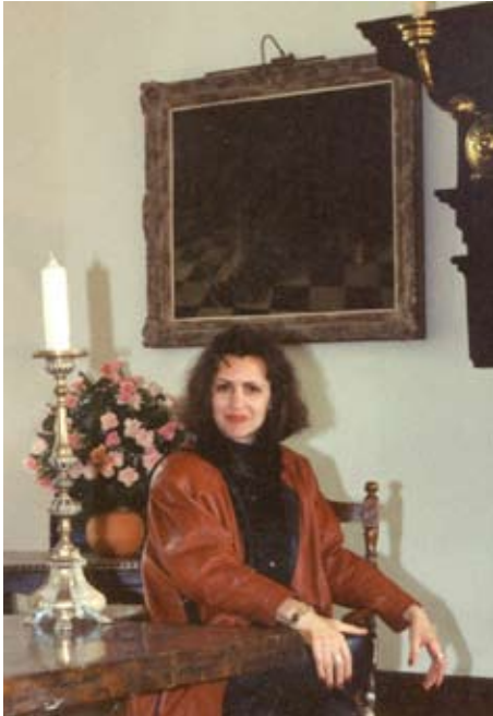
Dor de Renaștere