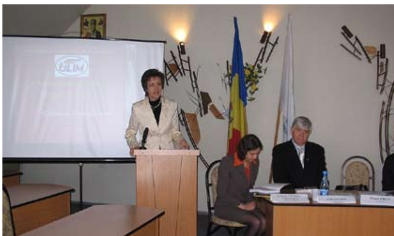
Regie de colocvii Francopolyphonie la ULIM